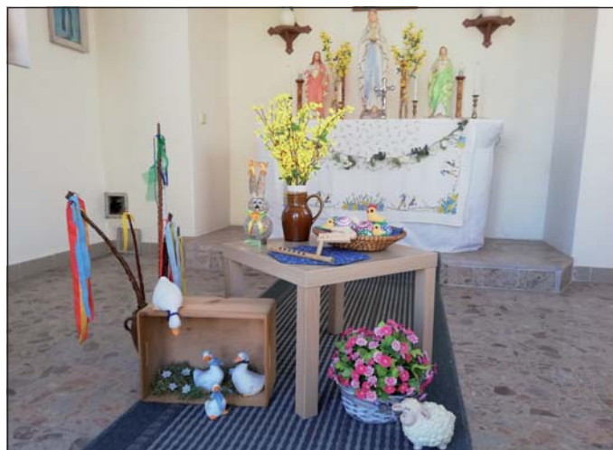
Kaplička v Josefovčích s jarní výzdobou.