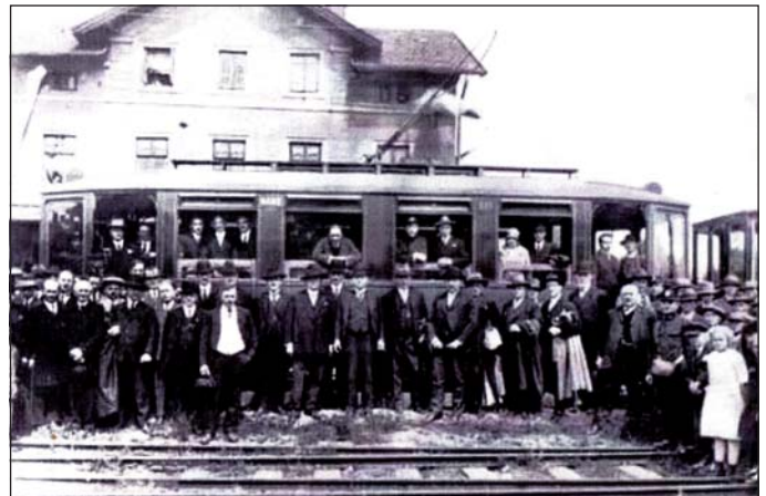
Zahajovací souprava elektrického provozu se slavnostními hosty v Klimkovicích 16. května 1926.