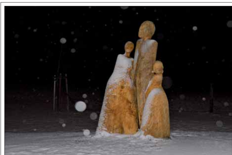
V den uzávěrky tohoto čísla Zpravodaje napadl v Klimkovicích první sníh.