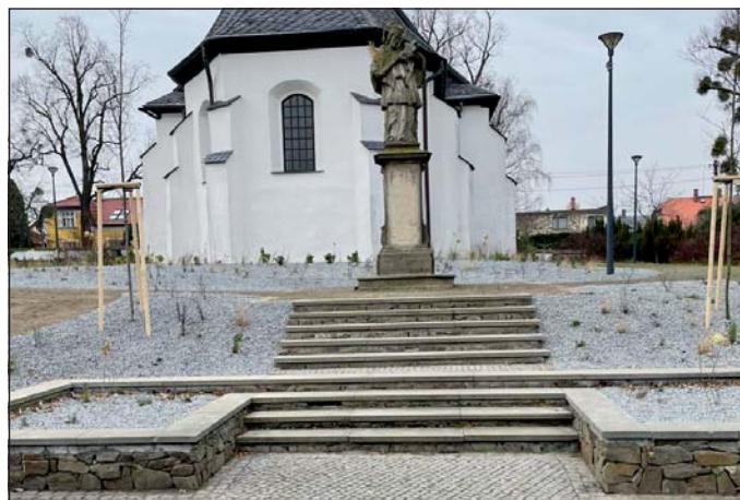
Zatím vypadá smutně, na jaře však ožije barvami nově vysazených cibulovin.

Skladba rostlin je ohromující: bylo vysazeno 3 900 kusů cibulovin, které se postarají o první jarní barevné koberce, přes 1 000 kusů trvalek a travin vytvoří bohatou texturu záhonů a 193 okrasných keřů dodá prostoru požadovanou strukturu.