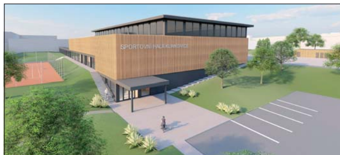
Vizualizace sportovní haly dle projektantů z FIALA ARCHITECTS s. r. o.

Aby se dalo zázemí školy a sportoviště smysluplně propojit, vznikne mezi oběma budovami spojovací krček. Studie halu zasazuje do svažitého terénu tak, aby co nejlépe využila výškové