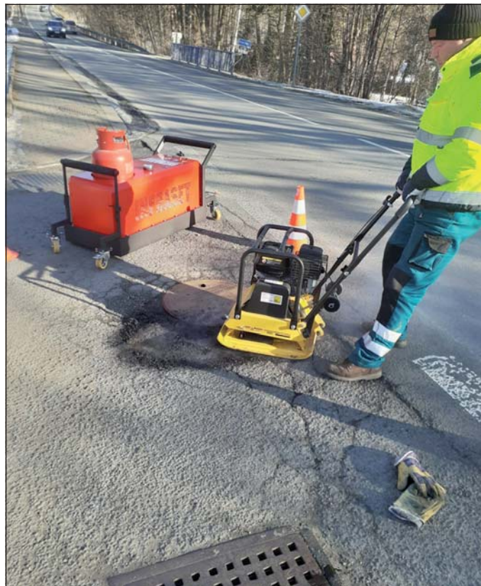
Práci s novou technologií si chlapi z technické správy vyzkoušeli na křižovatce ul. Palackého a Čs. armády hned druhý lednový týden.

Občané mohou město na poškozené silnice, výtlučky v asfaltu i další závady upozornit také přes WhatsApp skupinu, do které se nejjednodušeji připojí pomocí QR kódu. V hlášení stačí