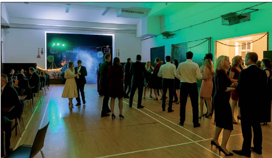
Do sokolovny míří lidé za sportem i zábavou, jako třeba předposlední lednovou sobotu na Záškolácký ples. (red)

Cílem nového systému je, aby budova nezůstávala nevyužitá, aby se předešlo neřízenému obsazování a aby město pokrylo část provozních nákladů z hrazení pronájmů. Jak velký bude efekt, ukáže čas, dosud nesl všechny náklady výhradně městský rozpočet. (red)