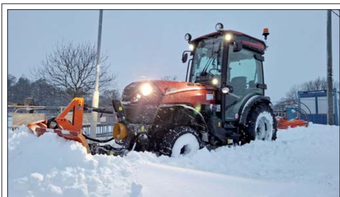
Traktor Case IH Quantum slouží technické správě už od podzimu. Při odklizení lednové sněhové nadílky byl „malý Kejs“, jak mu chlapi z TS říkají, v provozu téměř nepřetržitě.